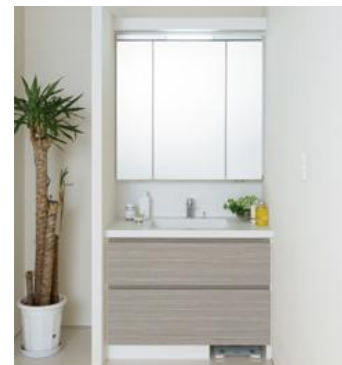
※写真は幅1000サイズです。