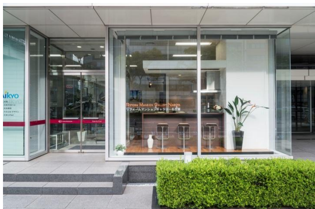
「リフォームマンションギャラリー名古屋」外観

今後、大京エル・デザインでは「リフォームマンションギャラリー名古屋」を拠点に中京エリアのリフォーム需要を開拓し、3年後にリフォーム売上げ倍増を目指してまいります。