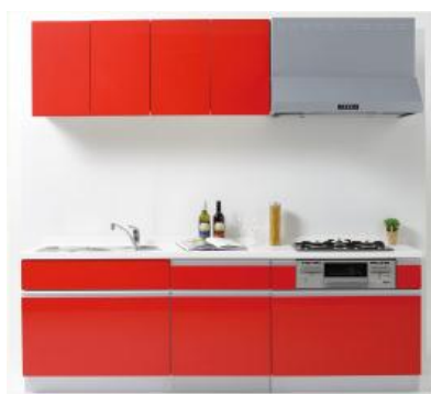
※写真は幅2400サイズです。