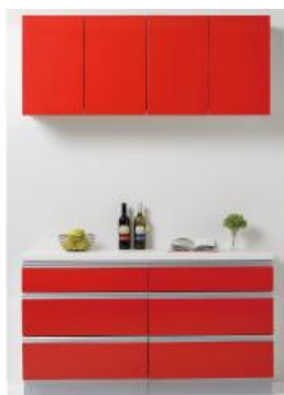
※写真は幅1500サイズです。