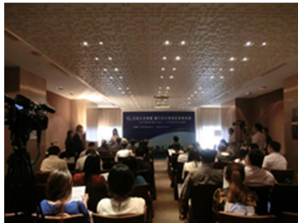
台湾におけるインバウンド事業開始の記者発表会 2014年6月開催