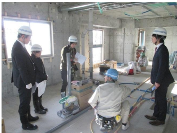
日本で研修を受ける香港現地スタッフ