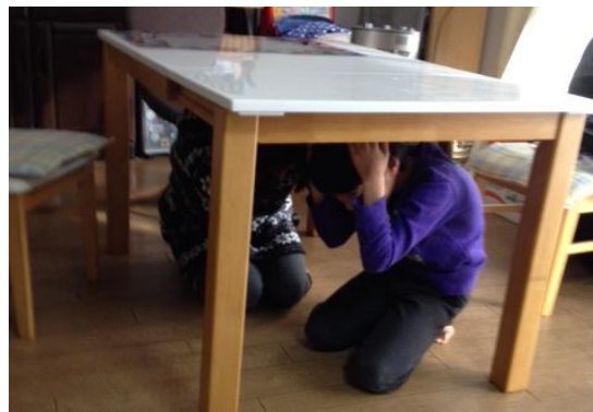
職場（左）や自宅（右）でのシェイクアウト訓練の様子