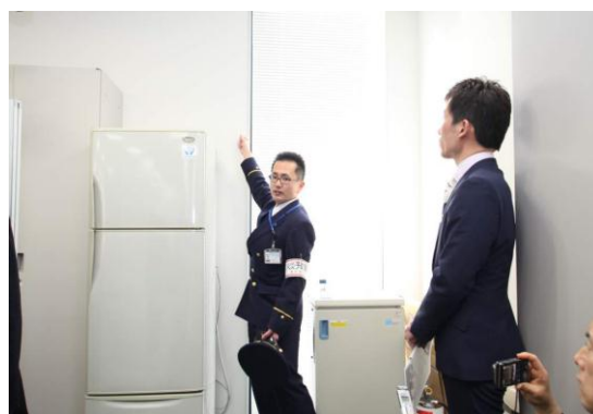
家具類転倒対策チェック