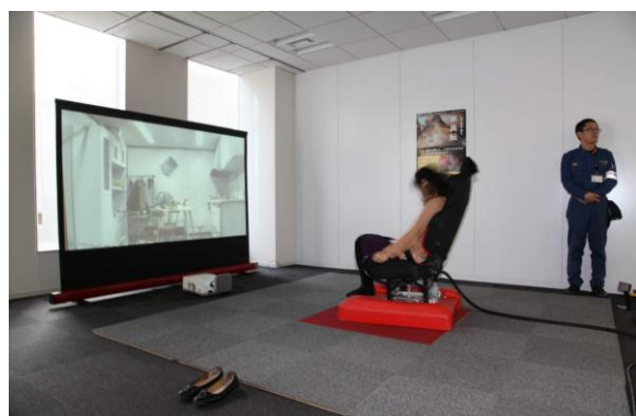
地震シミュレーター「地震ザブトン」の体験