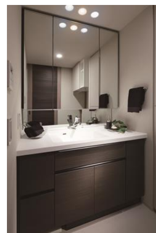
Ki-Le-i DRESSER （キレイドレッサー）

『Nature & Gentle（ネイチャー&ジェントル）』では、“自然素材の優しい手触り感”をキーワードに、自然素材の風合いの良さを肌で感じる事が出来る色彩素材を使用することで、柔らかく温かみのある住まいを演出しました。