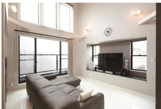
プレミアムパック（Urban Stylish イメージ）

※対応エリアは首都圏（東京・神奈川・埼玉・千葉/一部対応できないエリアがあります）のみのご案内となります。