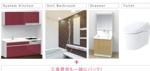
エルズパック（イメージ）