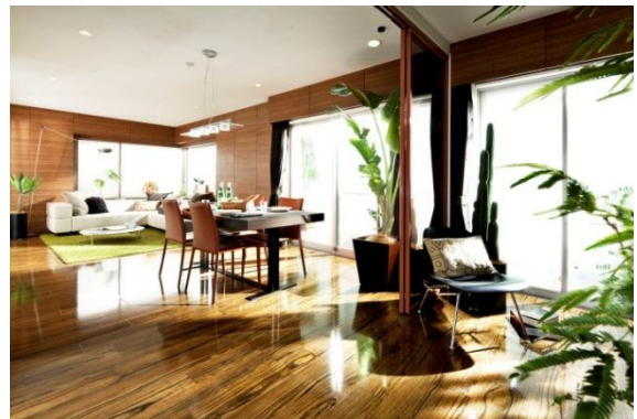
中古マンションのリフォーム後（イメージ）

※ 大京穴吹不動産によるリノベーションマンション販売件数と 中古マンション売買仲介件数の合計（全社）