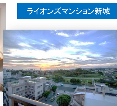
ライオンズマンション新城