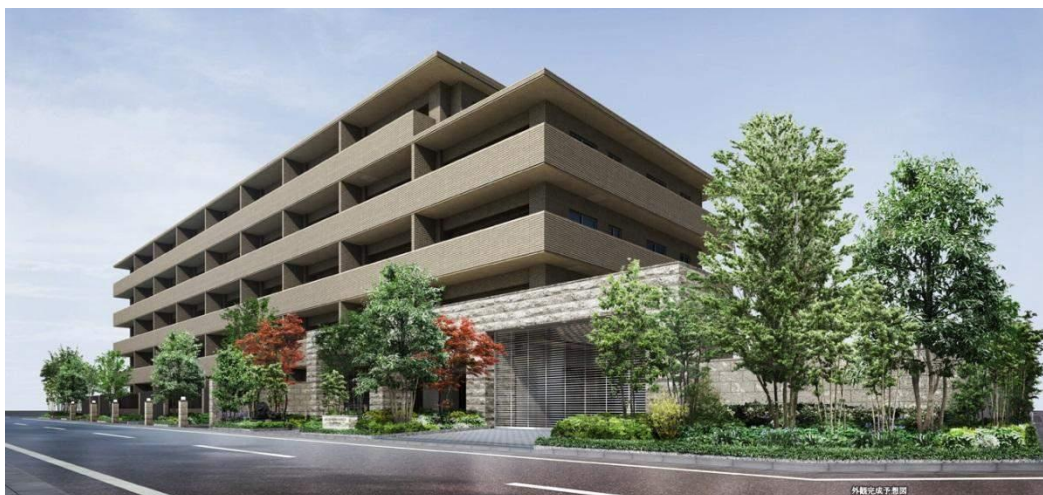
ライオンズ関町北グランヒルズ外観(完成予想図)