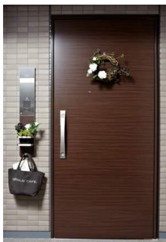
ドア設置イメージ（室外側）

今後、この新商品を、ライオンズ新瑞橋グランゲート（愛知県名古屋市、2017年2月竣工予定）、（仮称）ライオンズ吹上（愛知県名古屋市、2017年3月竣工予定）に順次採用してまいります。これからも大京では、機械に頼らない環境コントロールや室内環境への配慮を通じて、快適な住環境を提供してまいります。