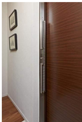
ドア設置イメージ（室内側）