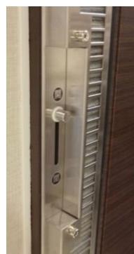
レジスター操作部