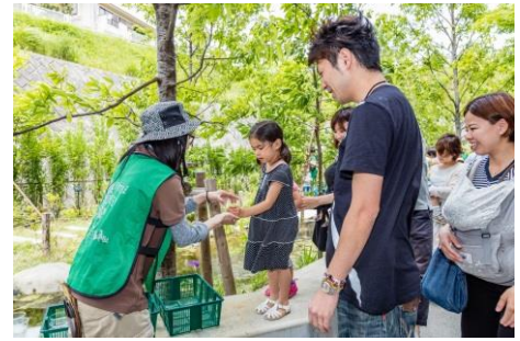
メダカと触れ合う親子