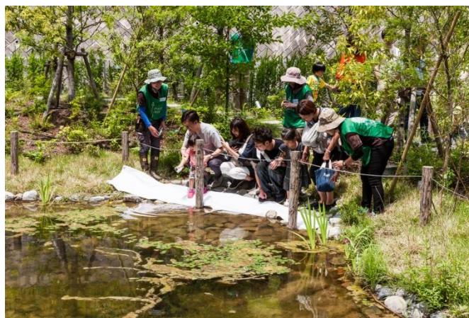
メダカ放流会の様子