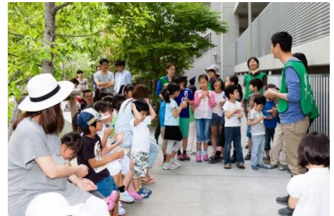
ビオトープ前にて生態系のご説明