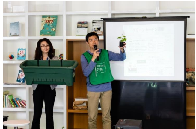
グリーンカーテン講座の様子