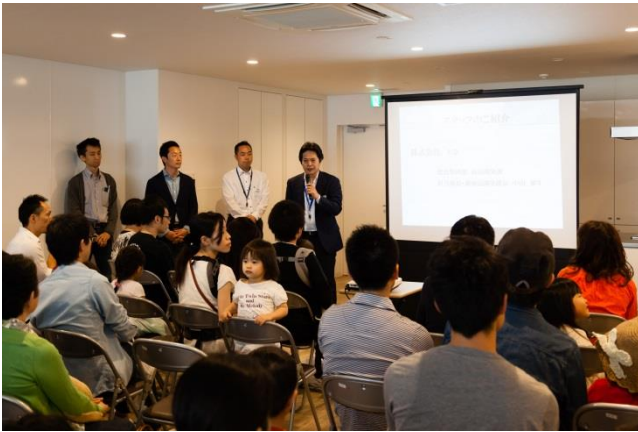
設計コンセプトのご説明

ご参加いただいた方は、生態系について関心をお持ちの方も多く、今回のイベントによって、ビオトープの管理等についても理解を深めていただくことができました。また、入居者同士だけでなく、スタッフと交流する場面も多く、コミュニケーションの場となったイベントでした。