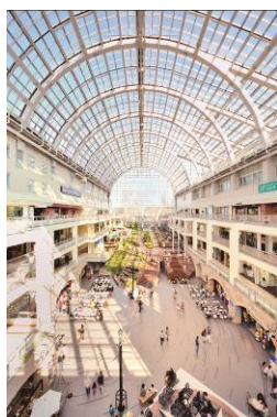
「サッポロファクトリーアトリウム館」