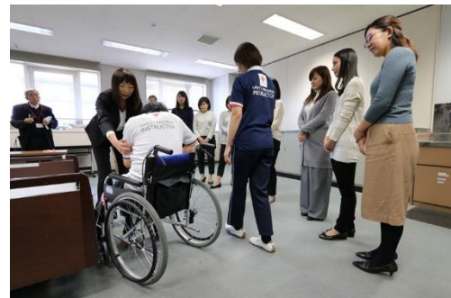
大京アステージ社員が実際に ベッドでの起き上がり介助を実践

◆ 本ニュースリリースに関するお問い合わせ先 ◆ 株式会社大京 広報・IR室（小野） TEL：03-3475-3802 日本赤十字社 広報室（森岡） TEL：03-3437-7071