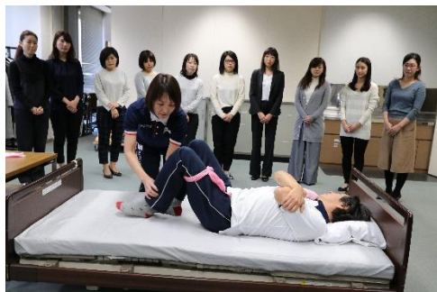
「健康生活支援講習支援員養成講習」 を大京アステージ社員が受講

今後は、大京アステージと日赤が協力することにより、「健康生活支援講習」を活用した「地域包括ケアシステム」の推進に貢献するのはもちろんのこと、大京アステージにおいては、習得した知識等を生かした「管理サービスの質の向上」や「新商品・新サービスの開発・提供」を目指してまいります。