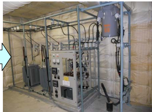
オリックス電力の変圧設備②