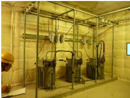
電力会社の変圧設備①