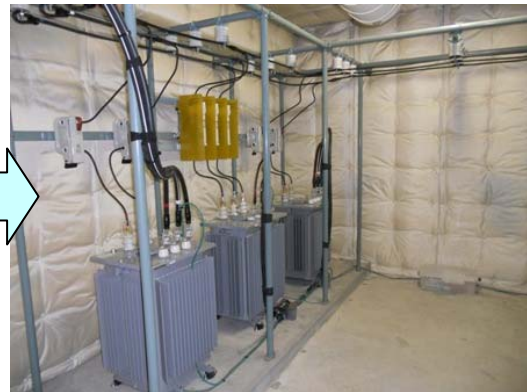
オリックス電力の変圧設備①