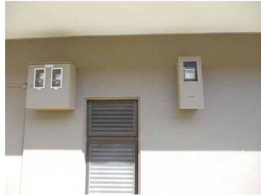
新たに設置された電力量計（右）