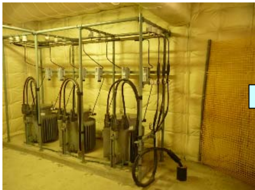
電力会社の変圧設備②