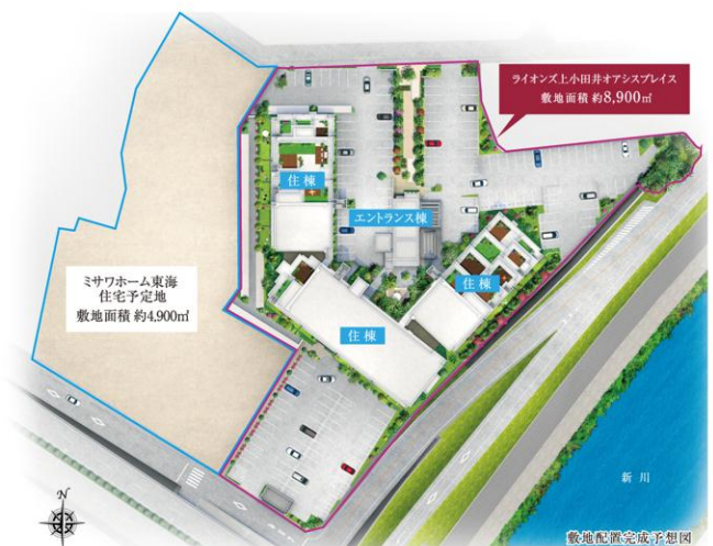
本協定の対象となる敷地配置完成予想図