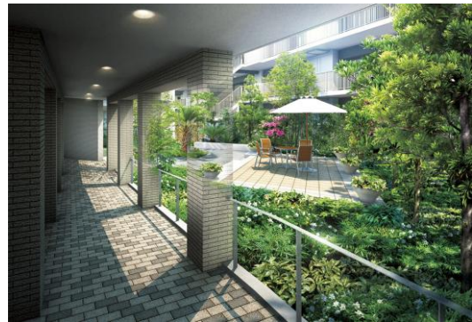
センターテラス完成予想図