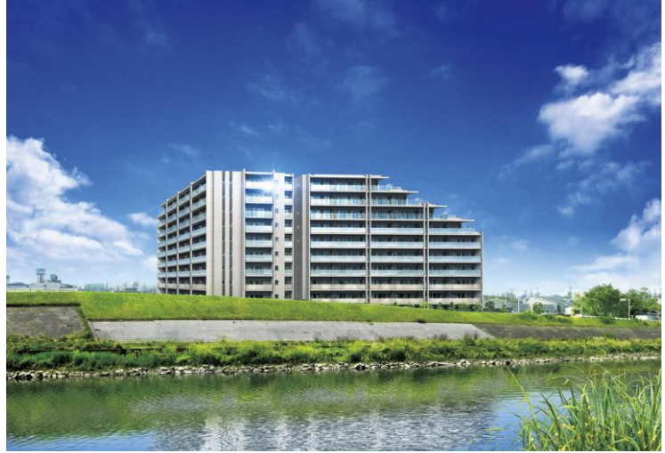
「ライオンズ上小田井オアシスプレイス」完成予想図