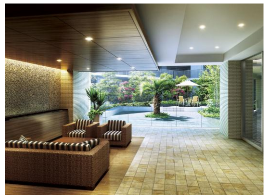
オアシスラウンジ完成予想図