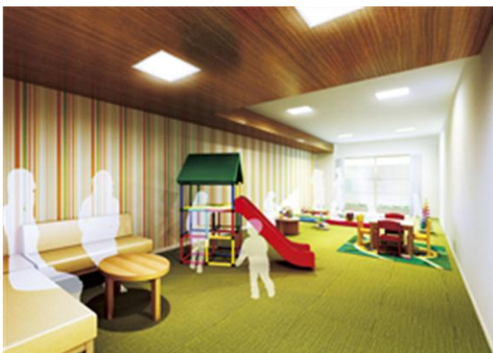
キッズルーム&ママコーナー完成予想図