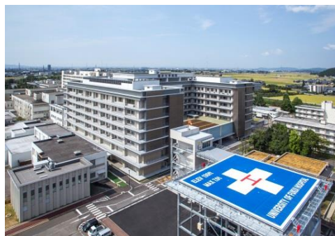
福井大学松岡キャンパス

そんな中、すでにビル管理サービスを提供していた福井大学で附属病院を含む全キャンパスを対象とした「管理一体型 ESCO 事業」の公募があり、プロポーザル方式の入札で、OFC を含むグループの提案内容が最優秀と認められ、2015 年 4 月から「管理一体型 ESCO 事業」を開始することとなりました。