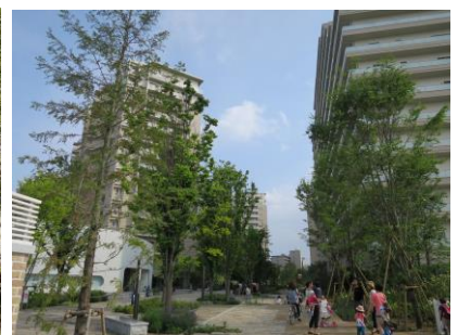
南北遊歩道北側の広場