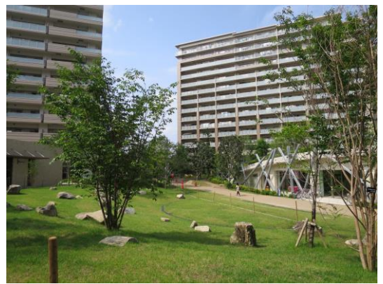
緩やかな傾斜のある芝生広