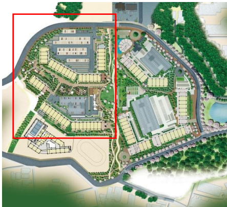
全体配置図（赤枠内がミリカ・テラス）