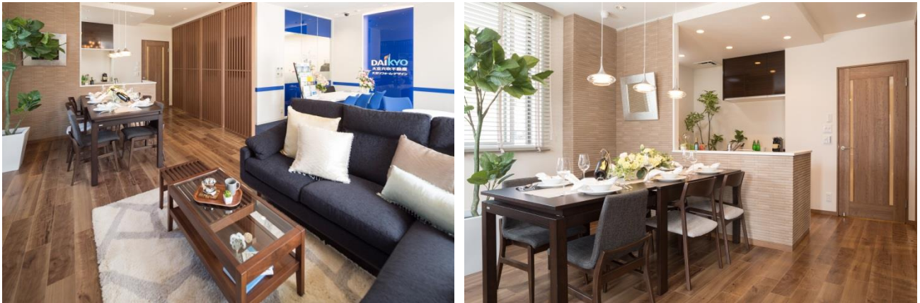
Reno α（リノアルファ）展示ルーム