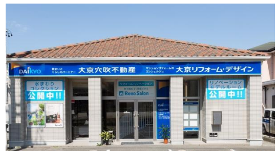
「Reno Salon 三河安城（リノサロン三河安城）」 の外観

大京グループの地域密着型ショールームには、マンション居住者のリフォーム需要として最も多い「水回り（キッチン、浴室、洗面台、トイレ）」を中心に、大手メーカーの実機12点を展示するほか、リノベーション住宅推進協議会の統一基準に基づく厳格な検査・点検を実施した、大京穴吹不動産のリノベーションマンション「Reno α（リノアルファ）」の品質を体感して頂くためのモデルルームを設置し、「Reno α（リノアルファ）」の購入検討者のみならず、ご自宅や購入予定物件のリフォーム検討者にもイメージが湧きやすい空間に仕上げました。