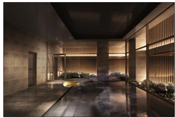
2階 大浴場 (イメージ)