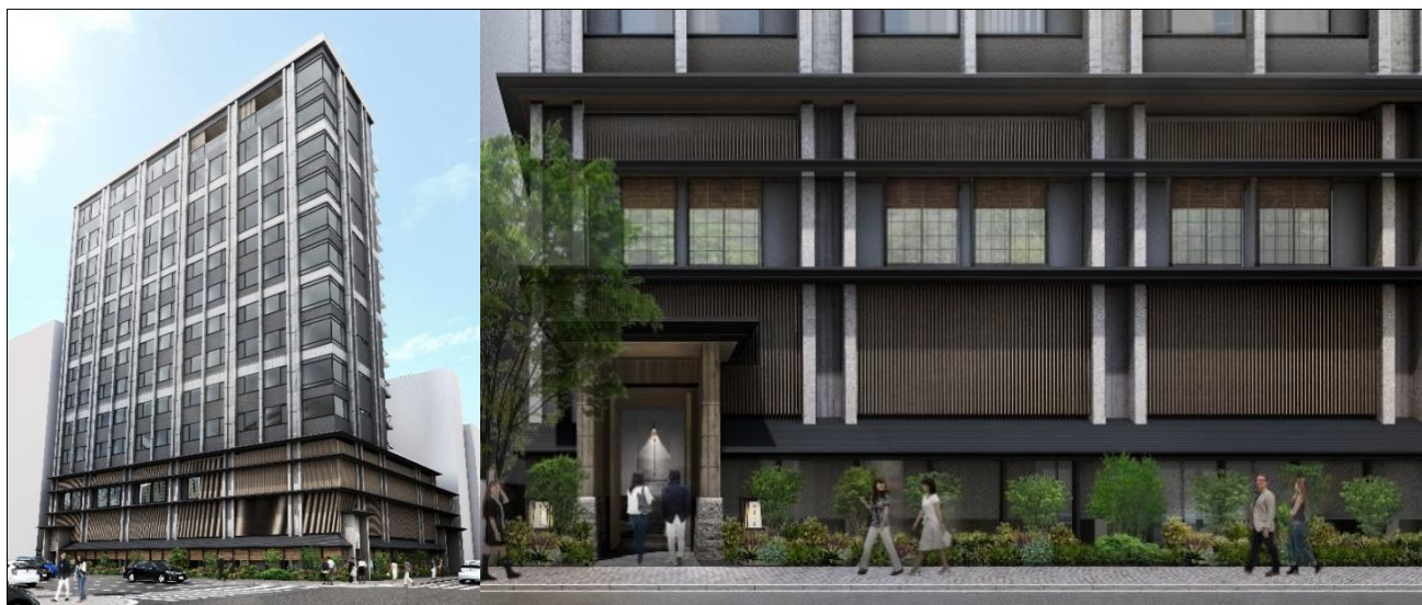
「ONSEN RYOKAN 由縁 札幌」外観イメージ

全国47都道府県に事業基盤を持つ大京グループの強みを生かし、日本全国の主要都市での事業化を進めるとともに、事業規模につきましても積極的な拡大を目指します。 また、プロジェクトごとに周辺地域の特色を生かしたホテル開発を行い、地域の活性化への貢献に取り組んでまいります。