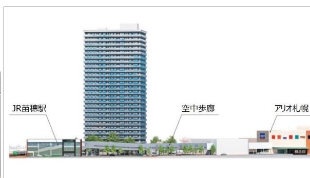
「空中歩廊」 （イメージ図）

札幌の都市再生を進める本事業の一環として、「苗穂」駅北口から商業施設「アリオ札幌」1階敷地までの約200mを屋根や壁で覆われた全天候型の空中歩廊で結びます。「苗穂」駅の南北を結ぶ自由通路にも直結し、雨や雪の影響を受けることなく、快適にご移動いただけます。今後、アリオ札幌2階部分へ空中歩廊の開通を予定していますが、その時期については現在未定です。