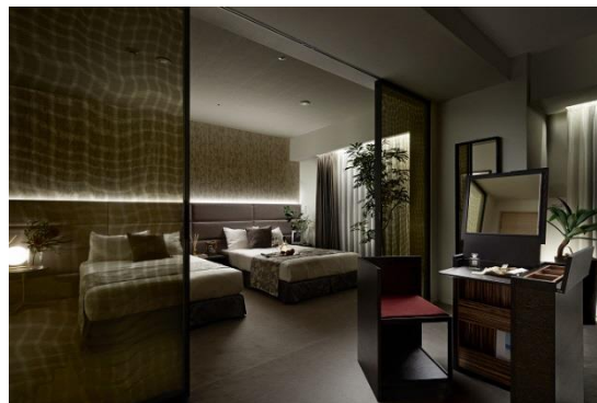
マスターベッドルーム (モデルルーム)