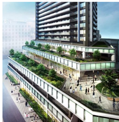
柳ヶ瀬ガラスル 35（イメージ）

高島屋南地区第一種市街地再開発事業（柳ヶ瀬ガラスル 35）は、高島屋南市街地再開発組合が施行者として、岐阜県岐阜市柳ヶ瀬の南玄関口で推進している事業です。1、2階は商業施設、3、4階は岐阜市が整備する公益的施設となります。3階には、運動を通じた健康づくりを支える健康・運動施設や岐阜市中保健センターを、4階には遊びを通じた子どもの成長と子育てをサポートする子育て支援施設を整備する予定です。分譲マンション「ライオンズ岐阜プレミスタワー35」は5階～35階に位置し、柳ヶ瀬エリアのランドマークとして、中心市街地活性化の実現を目指します。