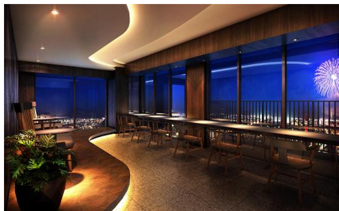
スカイラウンジのラウンジ（イメージ）

本物件は、岐阜市が設定した「まちなか居住重点区域」の中心となる柳ヶ瀬エリアに位置し、官民一体の複合再開発の「住」を担います。地上35階建て、岐阜県最大*の総戸数335戸のタワーマンションとして、2023年3月の入居開始を目指します。