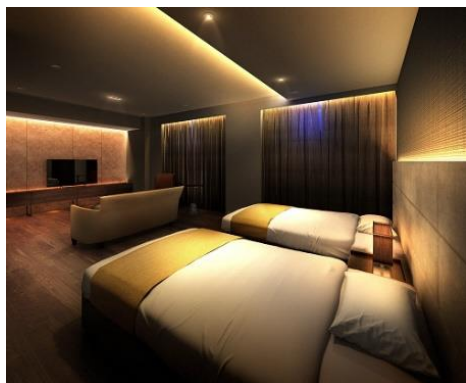
ゲストルーム (イメージ)

天井高約 5m の空間に光壁を装飾した「エントランスホール」のほか、パーティーコーナーが併設された「スカイラウンジ」、大切な方をもてなす「ゲストルーム」などホテルライクな共有施設を備えます。また、「防音ルーム」は、楽器演奏や映画鑑賞などさまざまな目的にご利用いただけます。居住者用の駐車場区画を 303 台確保した自走式立体駐車場は、専用のカーエントランスを使用することで同乗者は雨天時も濡れることなく乗降が可能です。