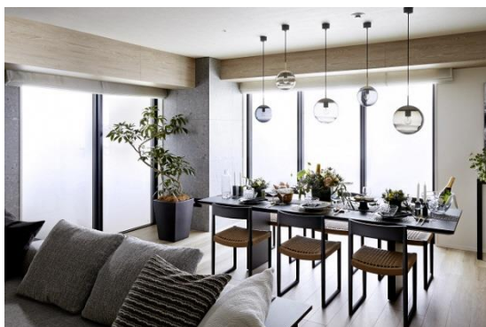
リビングダイニング (モデルルーム)

専有面積は 46.90 m 2 ~156.32 m 2 (1LDK~4LDK) で、すべての居室からの眺望を確保したプランや、すべての洋室にウォークインクローゼットを配し豊富な収納を確保したプランなど 62 タイプのバリエーションをご用意しました。また、最上階の 35 階には、スカイビューテラスを備えた 100 m 2 超のトップグレード住戸を 6 戸設けました。