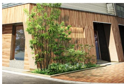
外観基壇部イメージ

サブカルチャー文化の発信地で若者の街である中野は、再開発により新しい街に変貌しつつあります。一方で、中野サンモールや新中野商店街など、人と人との温かな関係性と昔ながらの面影が残っています。その街に馴染むよう、基壇部は木目調のタイルで柔らかいイメージに、高層階は縦横のアルミ格子を配し、基壇部とのコントラストがアクセントとなるデザインとしました。