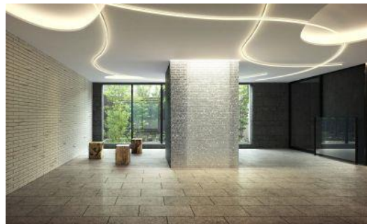
ラウンジ (イメージ)