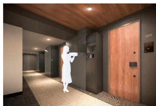
ライオンズスマートボックス（イメージ）

本物件は、京成電鉄本線および押上線「青砥」駅から徒歩12分に位置し、徒歩3分圏内に複合商業施設、5分圏内に小・中学校、公園、公共施設がそろそろなど、生活利便施設と子育て環境が充実しています。