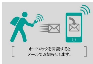
帰宅お知らせメールイメージ

ご家族が外出先から戻り、エントランスのオートロックを解錠すると、指定のメールアドレスへメールで通知する「帰宅お知らせメール」を採用しています。また、アプリを使ってエアコンや床暖房のオンオフ、お風呂のお湯はりなどを遠隔操作できるIoT機能を備えました。