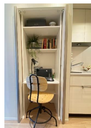
ワークフィットボックス (イメージ)

共用部では、指をボタンにかざすだけで操作できる非接触型エレベーターを導入します。住戸内には、クローゼットスペースを活用した機能的でコンパクトなワークスペース「ワークフィットボックス」を一部住戸に用意します。また、換気の悪い密閉空間を改善するため、室内の二酸化炭素濃度が設定 ※ を超えると、自動的にレンジフードが作動し換気する機能をもつセンサーを採用しています。室内の状況に応じた自動換気で衛生環境を保ちつつ、在宅時間をより快適にお過ごしいただけます。