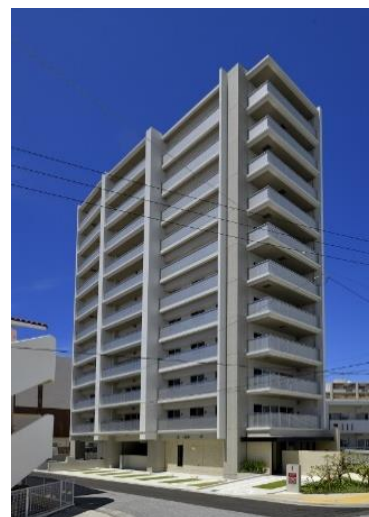
ライオンズ宜野湾 グランテラス

宜野湾港マリーナまで徒歩12分、生活利便性を備えたエリアに位置し、日常生活の中で沖縄西海岸の魅力を感じていただけます。三面接道の開放的な地形を生かし、全区画平地式駐車場を設えたほか開放的な住空間も実現しています。