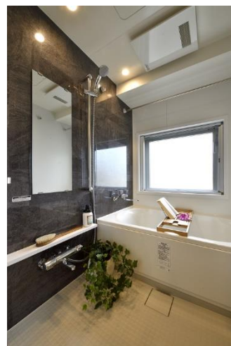
採光と通風を確保したバスルーム

角住戸の特徴を活かし、バスルームにも開口部を設けることで、住戸内の至る所で通風と採光をより確保しやすい開放的な間取りとしました。そのほか、全住戸にウォークインクローゼットやオープンカウンターキッチンを採用するなど、暮らしやすさに配慮しています。