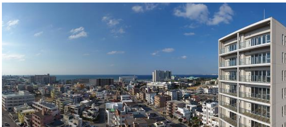
外観(右建物)と周辺の風景