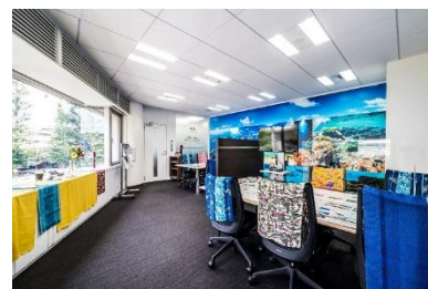
ライオンズ東京インフォメーションセンター

首都圏から沖縄への移住やセカンドハウス需要増加にお応えするべく、2020年10月より現地モデルルームとは別に、東京都渋谷区に「ライオンズ東京インフォメーションセンター※」を開設し、お客さまへご案内しています。現在販売中の「ライオンズ那覇三原マスターズゲート」では、ご契約いただいたお客さまの約3割が県外の在住者（そのうち約7割が首都圏在住）となっています。当社は現在、沖縄県で3物件（本物件含む）を販売しています。