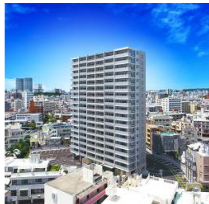
ライオンズ那覇三原 マスターズゲート

ゆいレールで「那覇空港」駅まで18分、那覇市のメインストリート「国際通り」から徒歩圏内と、生活利便施設が充実しながらレジャーも満喫できる環境です。建物は全戸南西向きの地上18階建て、エントランスには琉球石灰岩を採用し、上質な空間に仕上げました。