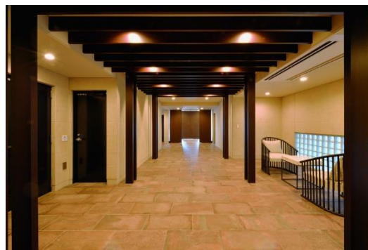
エントランス内部