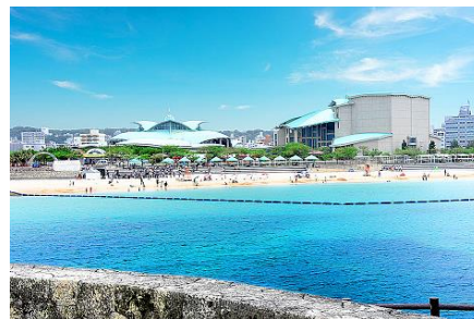
ぎのわんトロピカルビーチ

本物件の周辺には、さまざまな商業施設が集積しているほか、市民に親しまれている「ぎのわん トロピカルビーチ」(本物件より 1.3km) や「沖縄コンベンションセンター」(1.1km)、そしてアメリカンビレッジ (6.7km) などリゾートエリアに近く、食料品店「サンエー宜野湾コンベンションシティ」(500m) など生活利便性にもすぐれています。また、宜野湾市は公共施設の整備改善や良好な住宅地および商業地の開発に向けた土地区画整理事業が推進中で、今後も新しい街づくりが期待されるエリアです。