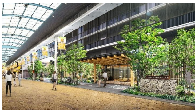
エントランス（イメージ）

本物件は、京阪本線「千林」駅徒歩 4 分、Osaka Metro 谷町線「千林大宮」駅徒歩 6 分と 2 駅 2 路線が利用可能です。両駅からは、大阪三大商店街の一つ※1「千林商店街」や「今市商店街」にアーケードで直結しているため、通勤・通学やショッピングなど、雨でも傘を差さずに移動ができます。梅田エリアへ電車で直通 12 分など、都心部へのアクセスも快適です。