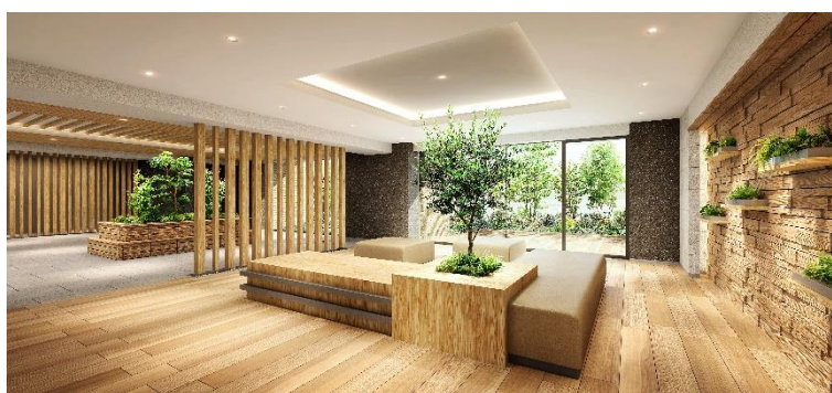
ラウンジ (イメージ)

1 階共用部には、エントランスにつながる入居者専用のラウンジを設置します。特長ある木格子やデザイン壁をアクセントとして取り入れます。屋外テラスや中庭とつながり、陽ざしと緑を感じられる開放的な空間です。