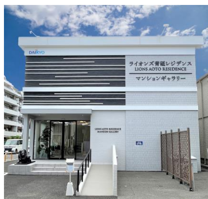
大京のマンションギャラリー（東京都葛飾区）

大京は、2018年に兵庫県芦屋市で、日本初の「Nearly ZEH-M」仕様マンションの販売を行うなど、両社はこれまで計 26 件の ZEH マンションを手掛け環境に配慮したマンション開発に積極的に取り組んでいます。今後は、新築マンション事業のプロセスや企業経営においても脱炭素を推進し、地球環境に優しい住まいづくりを加速します。今後も快適な暮らしと低炭素社会の実現を目指していきます。