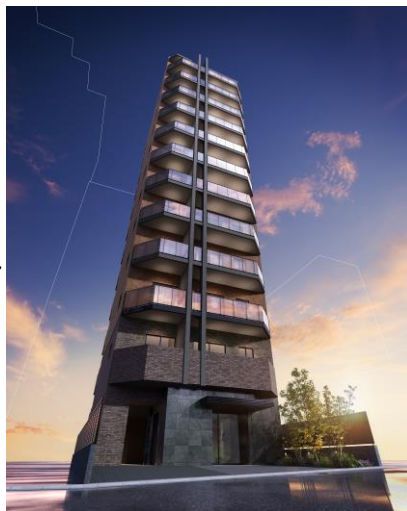
プライム虎ノ門外観 完成予想CG