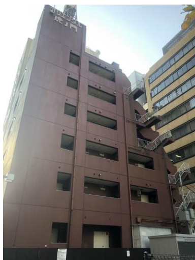
オリエンタル虎ノ門外観

今後増加するマンション建替えニーズに対応するため、マンション建替事業を進めていくとともに本事業を通して、沿線の発展、活性化を図ってまいります。