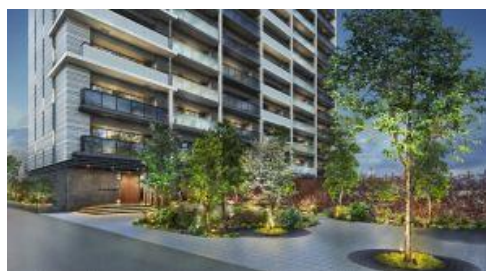
外観とエントランスアプローチ（イメージ）

外観は、地域の伝統的織物である「尾州織」をデザインコードに、たて糸とよこ糸の交差がもたらす特長を表現しています。また、20m あるエントランスへのアプローチには、一宮市のシンボルツリーである「ハナミズキ」を植え、地域の方も憩えるオープンガーデンを有します。オープンガーデンには、災害時に加熱調理が可能な「かまどスツール」を備えます。