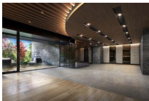
エントランスラウンジ（イメージ）

エントランスラウンジは、プライベートガーデンを併設し、木目調のルーバーと間接照明が美しい、安らぎと落ち着きの時間をお過ごしいただける空間です。