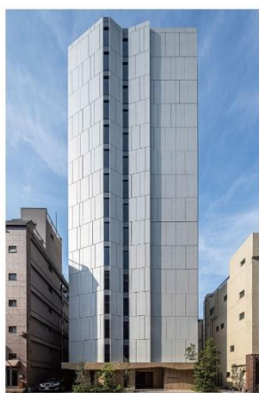
ライオンズフォーシア浅草橋 (2022年3月竣工)

「ライオンズフォーシア」は、2007年より展開する、分譲マンションの開発で培ったノウハウを活用した大京の賃貸マンションブランドです。これまで東京・神奈川・大阪・広島で24棟の開発実績（本物件含む）があり、各地の都心で働く20代～40代のシングルや共働きのご夫婦、小さなお子さまのいるご家族を中心にご入居いただいています。外観デザインはホテルや商業施設のトレンドを取り入れながら一棟一棟のデザインにこだわり、間取りは都心の賃貸居住者の生活ニーズに対応した多彩なプランを企画しています。