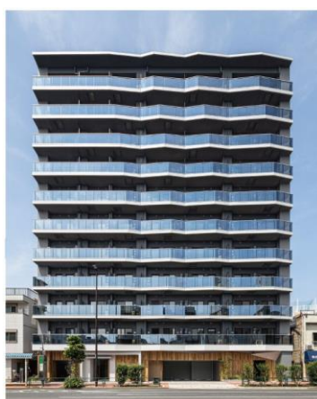
ライオンズフォーシア隅田川テラス (2022年4月竣工)