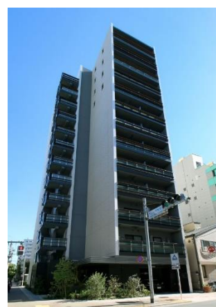
ライオンズフォーシア入谷イースト (2022年10月竣工)