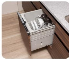
ビルトイン食器洗い乾燥機