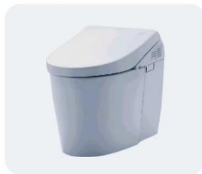
温水洗浄トイレ／機能付便座