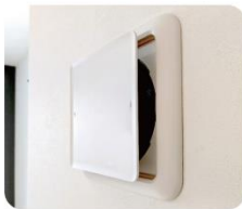
24時間換気システム