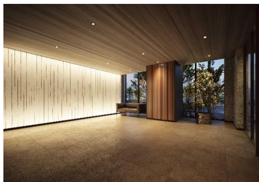
エントランスホール（イメージ）