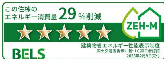
住棟の BELS 認証

本物件は ZEH-M Oriented 仕様を採用し、住棟全体と住戸において「BELS（建築物省エネルギー性能表示制度）」による第三者認証を取得しました。床、壁、天井部分に高断熱材を採用し、窓は Low-E 複層ガラスを使用することで室温の変化を押さえ、さらに高効率設備である換気設備や高断熱浴槽、LED 照明を採用することで大幅な省エネを実現します。また、共用部の一部の電力を賄う太陽光パネルを設置し、低炭素建築物認定も取得しています。さらに本物件は、分譲マンションとしては全国わずか 12 棟、北海道では唯一、令和 4 年度「中高層 ZEH-M 支援事業」の採択を受けています。