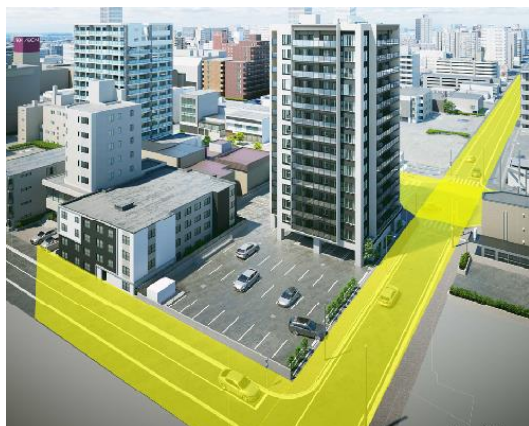
南西側外観（イメージ）

三方向が道路に面する敷地を生かしたランドプランを計画。南西面に駐車場を配して隣地と一定の距離を保つなど、独立性と開放感を高める工夫を施しています。また駐車場には全 41 台分の区画のうち 21 台分に EV 充電コンセントを設置したほか、ロードヒーティングを敷設し、降雪時も快適にご利用いただけます。さらに、駐車場側に車寄せとサブエントランスを設け、荷物の積み下ろしにも便利です。