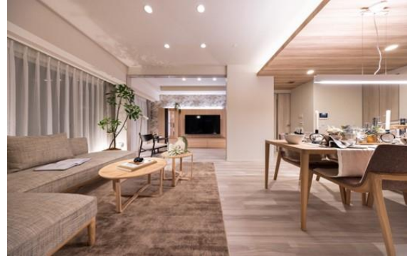
リビングダイニング（棟内モデルルーム 202 号室）