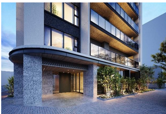
エントランス外観（イメージ）

エントランスには、丸みを帯びたコーナーのひさしや御影石を採用し、上質な邸宅の雰囲気演出します。建物全体には、グレーを基調にしながらバルコニーを囲うようにオフホワイトの縦のラインをアクセントに取り入れ、重厚でありながら伸びやかさを感じさせるデザインとしています。また、エントランスホールには光壁を、道路側には大型のガラスを配し、優しい光が出迎えます。