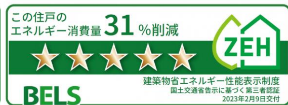
住戸の BELS 認証例（402 号室）